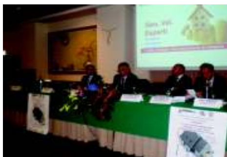
Seminario Ragusa 2010