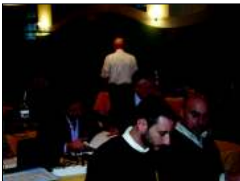
Corso Tutor Palermo 2009

Il corso si sviluppa in tre giornate di 8 ore ciascuna per complessive 24 ore d'aula.