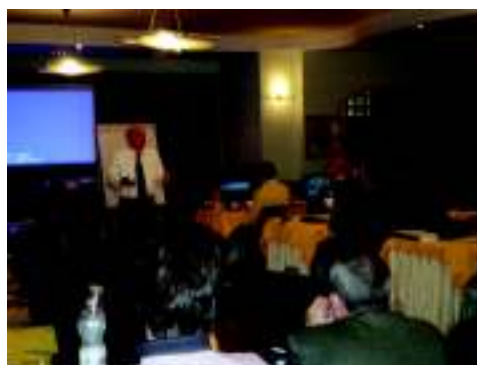
Corso Tutor Palermo 2010