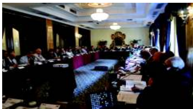
Meeting TEGoVA - ROMA 9 - 10 novembre 2012

Geo.Val.Esperti rilascerà l'attestato di partecipazione Per i Geometri iscritti all'Albo la partecipazione al corso prevede l'attribuzione di 24 Crediti Formativi Professionali