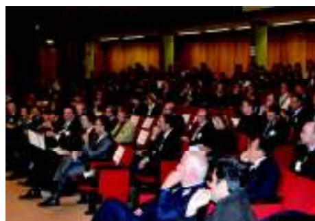
CESET - ROMA 13 novembre 2011